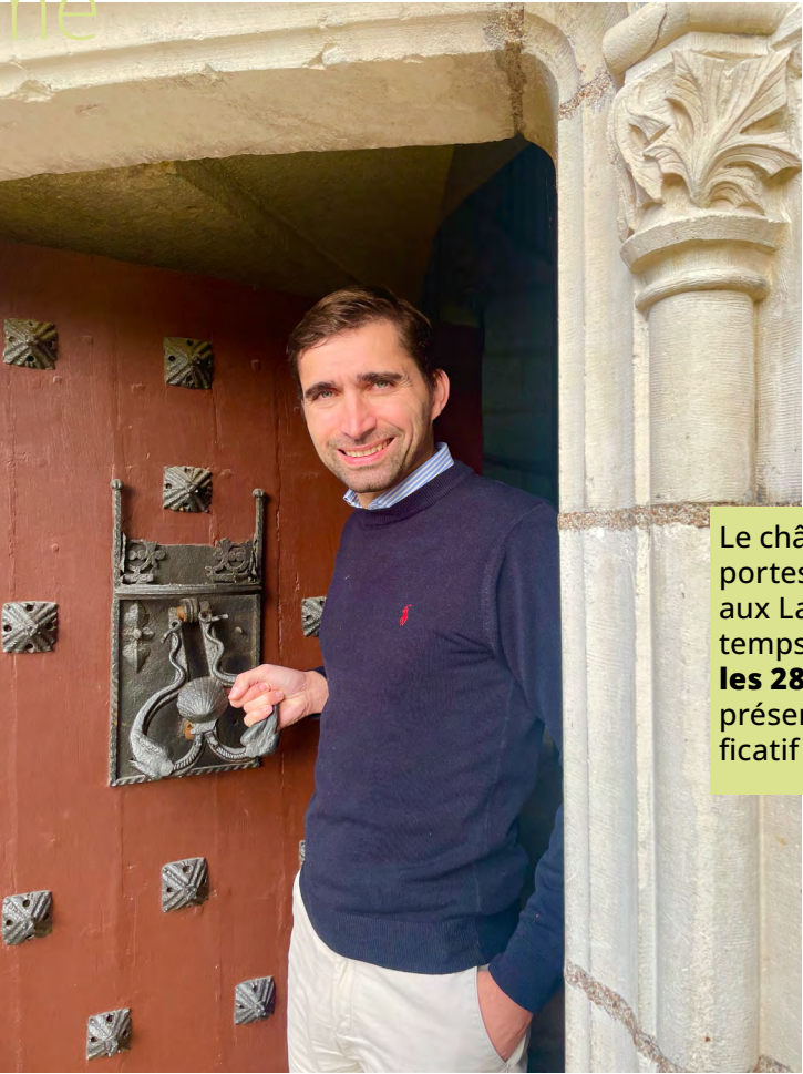
Le château ouvrira ses portes gratuitement aux Langeaisiens le temps d'un week-end les 28 et 29 mars sur présentation d'un justificatif de domicile.

en 1975. Une raison qui le poussera à créer le karaté contact, cette discipline demandant des frappes des poings, avec des gants, et des pieds,