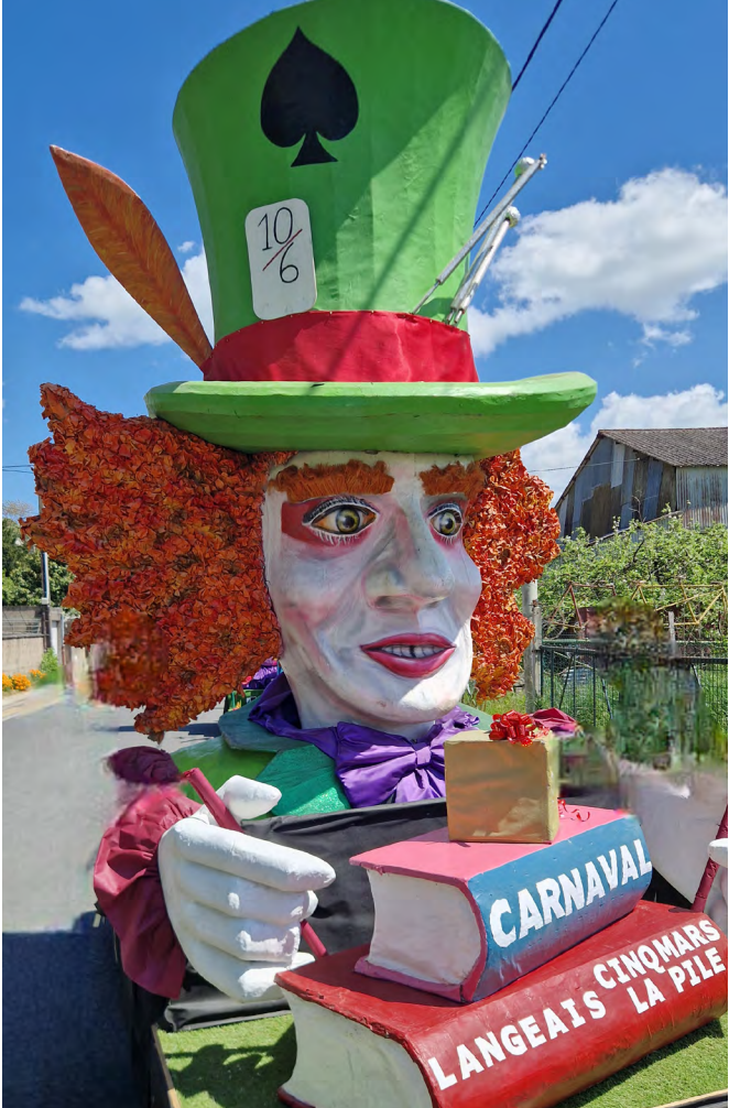
Les Carnavaliers du Pays Langeaisien communication.carnavaliers.37130@gmail.com https://www.facebook.com/share/16BtUnkrPa/ https://www.instagram.com/les_carnavaliers_37130?igsh=d3QzcDjhY3E1ZHQx

Carnavaliers, à vos marques ! Pour être sur le pied de... fête le 28 mars. Un samedi qui s'annonce particulièrement joyeux puisqu'il aura pour thème la fête foraine. Après « Alice aux Pays des merveilles » puis « l'Asie », cette troisième édition du carnaval commun Langeais-Cinq-Mars-la-Pile aura lieu cette année dans nos murs, « un véritable tourbillon de couleurs et de bonne humeur » étant promis par les Carnavaliers du Pays Langeaisien. Derrière ce nom se cachent des bénévoles : parents, enfants et habitants de toutes communes, portés depuis le début par l'association Agora. Toutes ces personnes, écoles et associations locales sont déjà à pied d'oeuvre pour imaginer chars, costumes et animations inspirés de l'univers des manèges, des confiseries et des lumières scintillantes. Un concours de brouettes décorées étant déjà prévu. Artistes, bricoleurs/euses, couturiers/ières ou simples curieux/euses : toutes les bonnes volontés sont les bienvenues pour rejoindre ce groupe de gais lurons « zé » gaies luronnes.