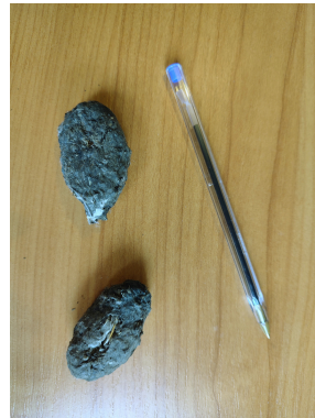
Pelotes de réjection